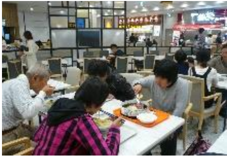
好きなメニューの屋食を美味しくいただきました

昼食は松本イオンモールで食べました。今回は好きなメニューを選ぶことができたので、ステーキを食べる方やラーメンを食べる方、デザートを食べる方など、いつものバス旅行と違い様々な食事を楽しんでいました。松本イオンモールの中は、広すぎて迷子になりそうだなあと感じながら皆さん買い物も楽しまれたようです。帰りのバスの車窓からは、松本城を見ることができ、和やかな雰囲気でのバス旅行になりました。