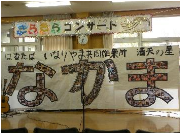
仲間の顔写真で作ったステージバック