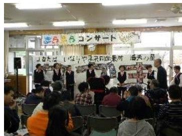
馴染みの曲に拍手をする仲間の皆さん