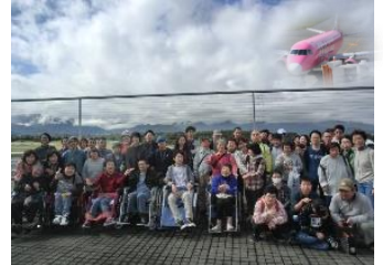
車いすから立ち上がり飛行機の到着を待つ