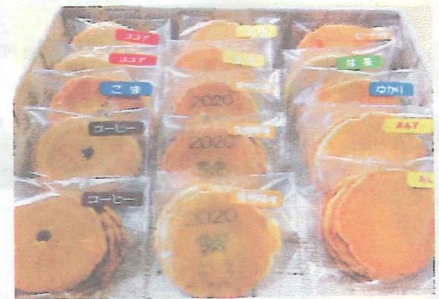
コーヒー、紅茶、ココア、味噌、プレーン、あんず味等